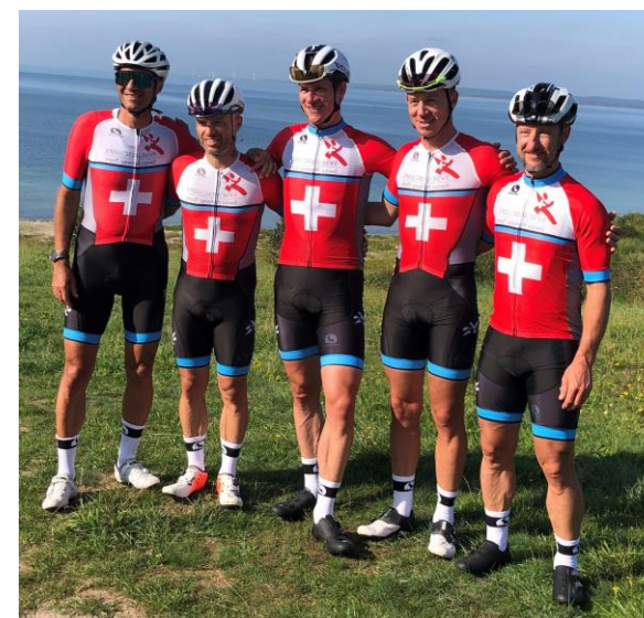
2. Rang Mannschaftsfahren USIC 2023 Dänemark Doppelsieg Strassenrennen USIC 2023 Dänemark